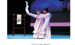
团体组合赛比赛瞬间