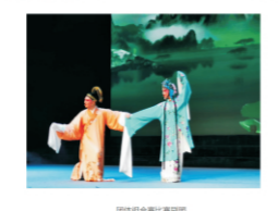
团体组合赛比赛瞬间