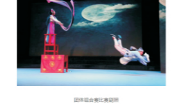
团体组合赛比赛瞬间