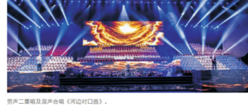
男声二重唱及混声合唱《岗位对歌曲》。

晚会分上、中、下三篇，分别为“不忘来时路”“壮丽七十年”“奋斗新时代”。在“不忘来时路”篇章中，男中音演唱《黄河颂》，配合诗朗诵《黄河之水天上来》，女声二重唱《黄河颂》等节目以中华民族的母亲河黄河为题材，讲述了在民族存亡的关键时刻，中华儿女前赴后继保家卫国的铮铮铁骨。在“壮丽七十年”中，编舞以情景歌舞《东方红》《我的祖国》《在希望的田野上》等节目，形象地展示了新中国成立以来农村面貌，走向改革开放的不平凡历程。