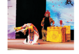
团体组合赛比赛瞬间

9月10日，由浙江文化广电新闻出版集团主办、浙江电视台承办的浙江省第十届十大城市戏曲演唱联赛在台州温岭市举行。来自全省各地的13支代表队，39名选手参加了激烈的角逐。